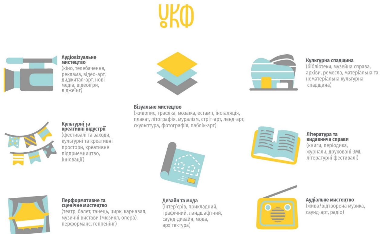
Діаграма 2: Культурні, креативні та аудіовізуальні сектори, що отримують підтримку

Існує багато класифікацій культурних, креативних та аудіовізуальних секторів. Визначення секторів, яким надає підтримку УКФ, базується на класифікації, прийнятій Виконавчою агенцією з питань освіти, аудіовізуальних індустрій та культури ЄС, та враховує термінологію українських законодавчих документів і особливості національного контексту. Також взято до уваги підходи окремих країн до адаптації міжнародних класифікацій, а саме ЮНЕСКО та Європейського Союзу, до національних умов.