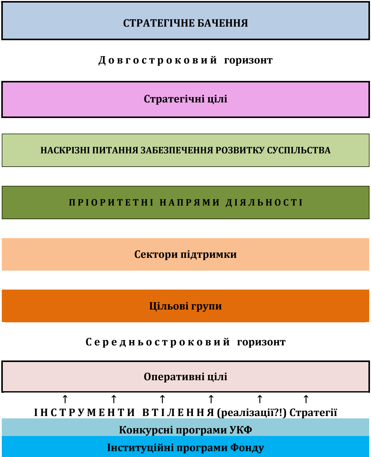
Діаграма 1: Логічна матриця Стратегії УКФ 2021